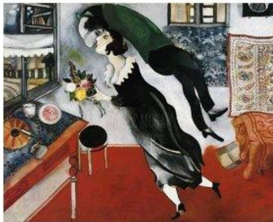
L'Anniversaire par Marc Chagall