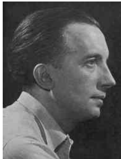
Éluard par Man Ray 1933