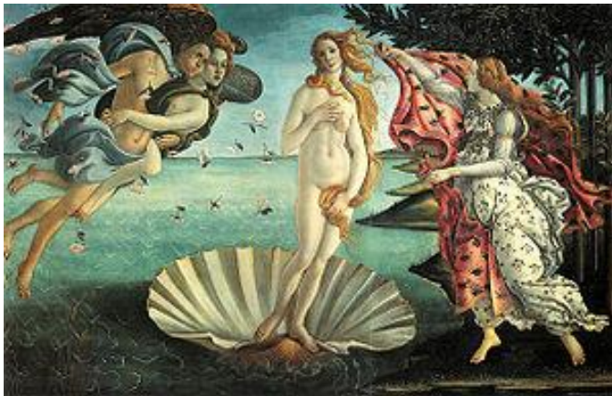
La Naissance de Vénus 1485 Sandro Botticelli

Dans le poème, vous avez lu que la femme sort de l'eau et du feu. Regardez les images ci-dessous. Est-ce que vous pensez que le poète s'est inspiré du tableau de Botticelli de la Naissance de Vénus et de la légende du Phénix ?